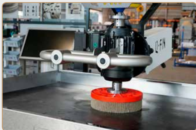
ProGrinder met optionele komborstel

Veilig en snel ontbramen en afronden voor een budgetprijs!