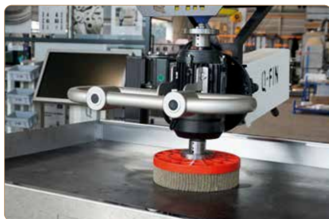
ProGrinder met optionele komborstel.

Veilig en snel ontbramen, afronden en finishen voor een budgetprijs met de ProGrinder van Q-Fin.